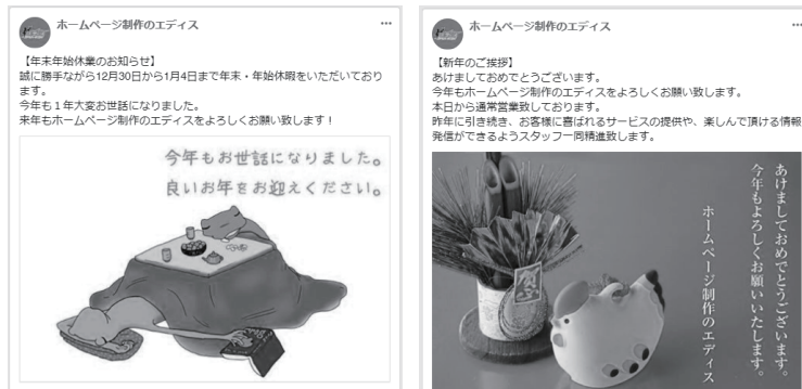
↑ 昨年度のエディスの年末年始休業のお知らせの掲載例です

スマートフォンの所持が当たり前となった今、最近は「SNSは毎日欠かさずチェックしている」ネットユーザーが多いです。ホームページに年末年始休業のお知らせを掲載するだけでなく、Facebook や Twitter など現在利用しているSNSがあればそちらにも年末年始休業のお知らせを更新しましょう！